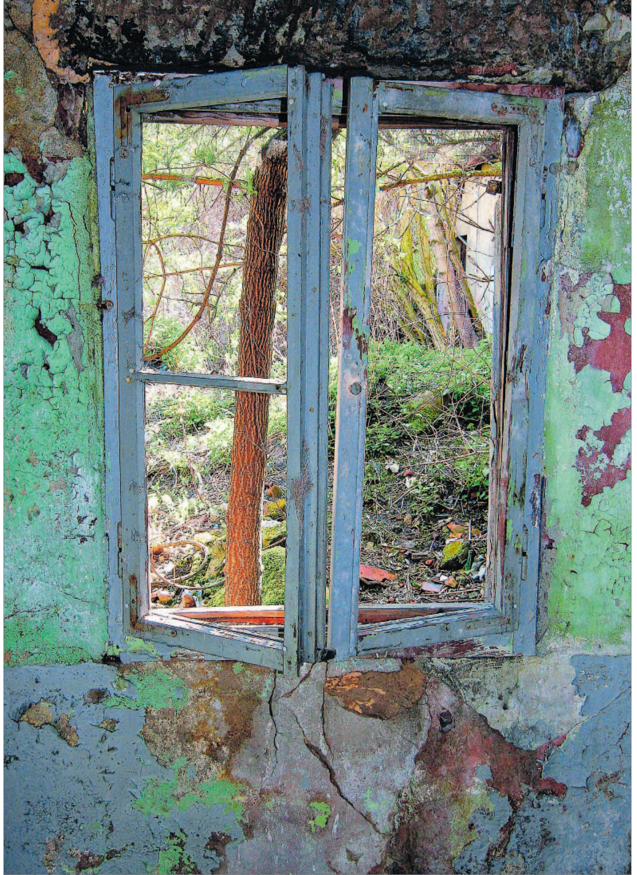
„Fenster“ heißt das Bild, das in der inzwischen abgerissenen Villa Zucker-Bär entstand.

So eine fotografische Geländebegehung ist nicht ganz ungefährlich. Allein schon wegen der vielen Wachleute von eigenen Gnaden. Mancher Passant fühlt sich persönlich auf den Schlipps getreten, wenn ein Fotograf sich in abgesperrtes Terrain vorwagt. „Es gibt immer Menschen, die einen gleich maßregeln wollen“, seufzt Marena. „Dann heißt es: ‚Des is fei mei Stroß!‘“ Dabei tue ich solchen Leuten ja einen Gefallen, ich würdige