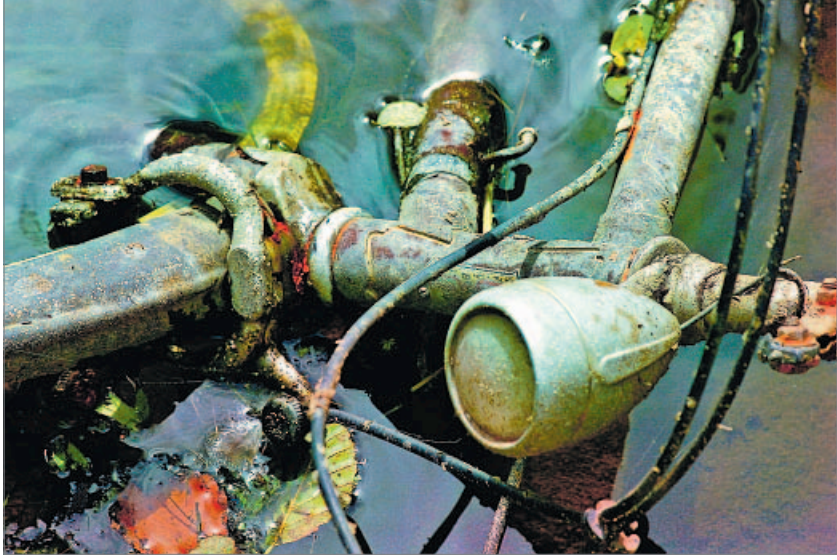
„Fahrrad“ – frisch aus der Pegnitz gefischt.