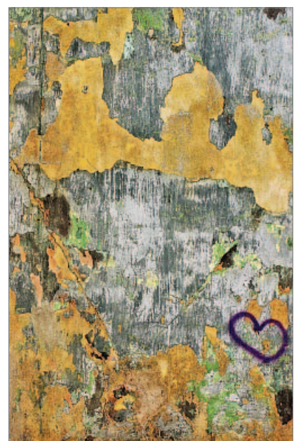
„Herz auf Gold“